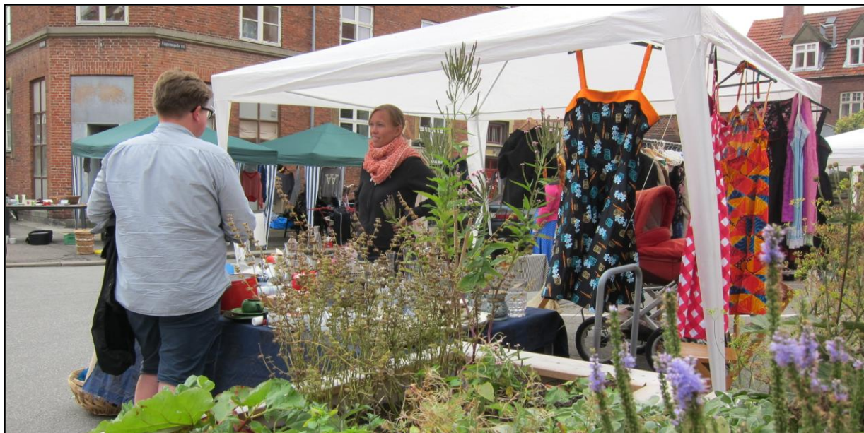
Loppe- og byttemarked i Ungarnsgade

Ungarnsgadenetværket er et gadebaseret netværk, der arbejder med at gøre Ungarnsgade til et grønnere og bedre sted at bo. De har i år bygget gadehaver, arbejdet for at forskønne vejens bede, holdt et loppe- og byttemarked, undersøgt muligheden for delebiler i gaden, en fælles storskraldsordning og for mere liv i de tomme butikslokaler og endelig er netværket i gang med at undersøge muligheden for at blive et vejlaug, så de kan få større indflydelse hos kommunen i forhold til vejens udformning.