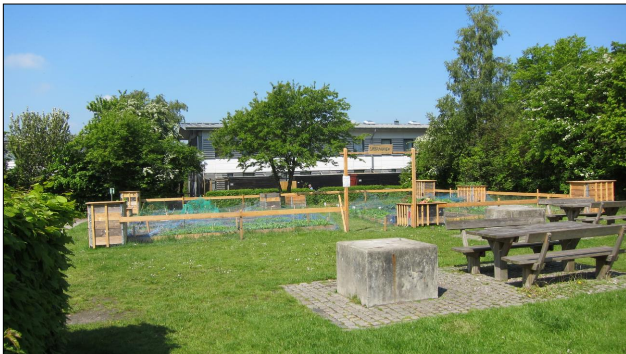
Urbanhaven i Remiseparken

På den internationale byhavekonference 'Eat Your City' har vi sat fokus på de potentialer og udfordringer, der relaterer sig til byhaver og bylandbrug, skolehaver og byhaver som social sammenhængskraft. Miljøpunkt Amager vil følge op på erfaringer fra konferencen ved blandt andet at gå i dialog med Københavns Kommune om, hvordan rammerne for den spiselige by kan forbedres.