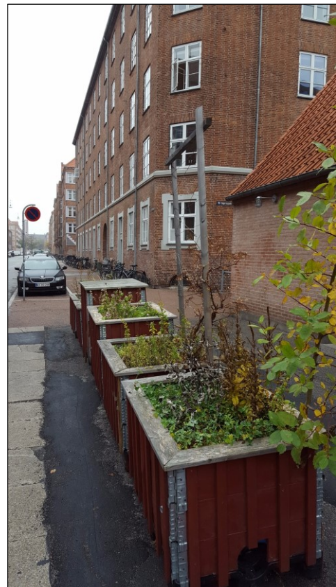
Gadehaver på Ungarnsgade

Som opfølgning på Park in a Week i 2015 på Prags Plads, hvor vi var i dialog med beboere og forbigående, havde vi i 2016 fokus på at realisere nogle af de konkrete ideer og forslag som der blev diskuteret. Blandt forslagene var bedre afmærkning af gå og cykel område, mulighederne for at skabe ophold med bænke, flere aktiviteter, plantekasser i forbindelse med cykelstativ samt kunst.