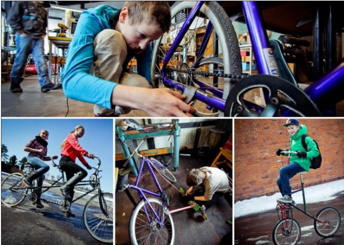
Billeder fra undervisningsforløbet Cykelbyg & Design.

Vi har i øvrigt haft fokus på at undervise børn ved åbningen af Trafiklegepladsen og ved workshop om cykelvedligeholdelse den 28. april.