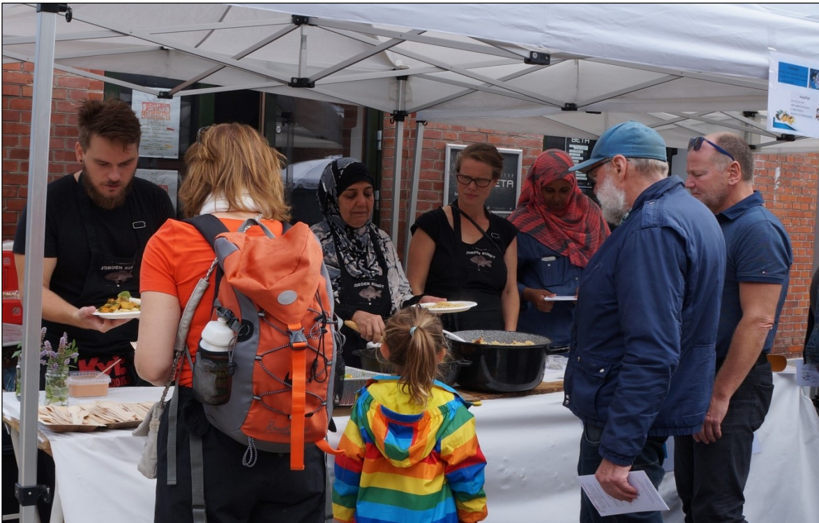
Streetfood på Lørdag på Musiktorvet.

Derudover kunne besøgende få inspiration hos Miljøambassadørerne og Kompostbudene om hvorledes man kan minimere madspild, samt opstarte kompostering der hvor man bor.