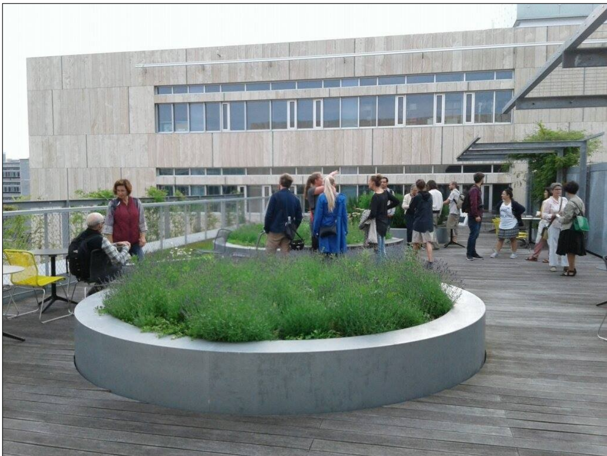
Guidet tur til Ørestads skjulte taghaver.

Den guidede tur den 22. juni var helt fyldt op 23 deltagere. Vi besøgte grønne tage i boligforeninger, parceller, cykelskure og institutioner i Ørestad Nord.