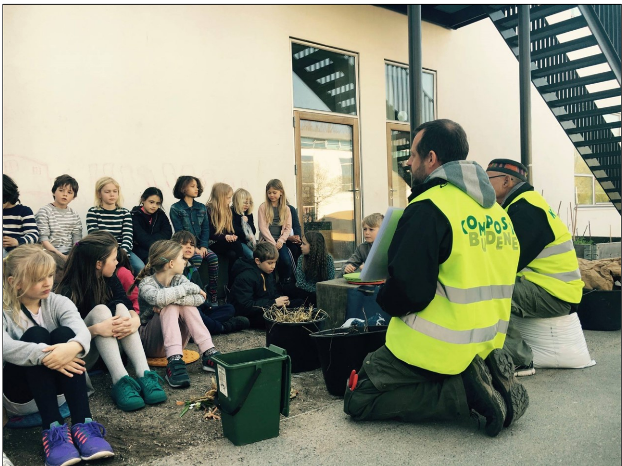
Undervisning om ressourcekredsløb og kompostering med Kompostbudene

Det er tydeligt at byttemarkeder for alvor er kommet for at blive. Der er på Amager en stor efterspørgsel efter byttemarkeder og lignende faciliteter som gør det muligt for borgerne at recirkulere og dele deres udtjente og brugte ejendele. I løbet af 2016 har Miljøpunkt Amager afholdt to byttemarkeder, samt en række mindre arrangementer med fokus på genbrug og genanvendelse.