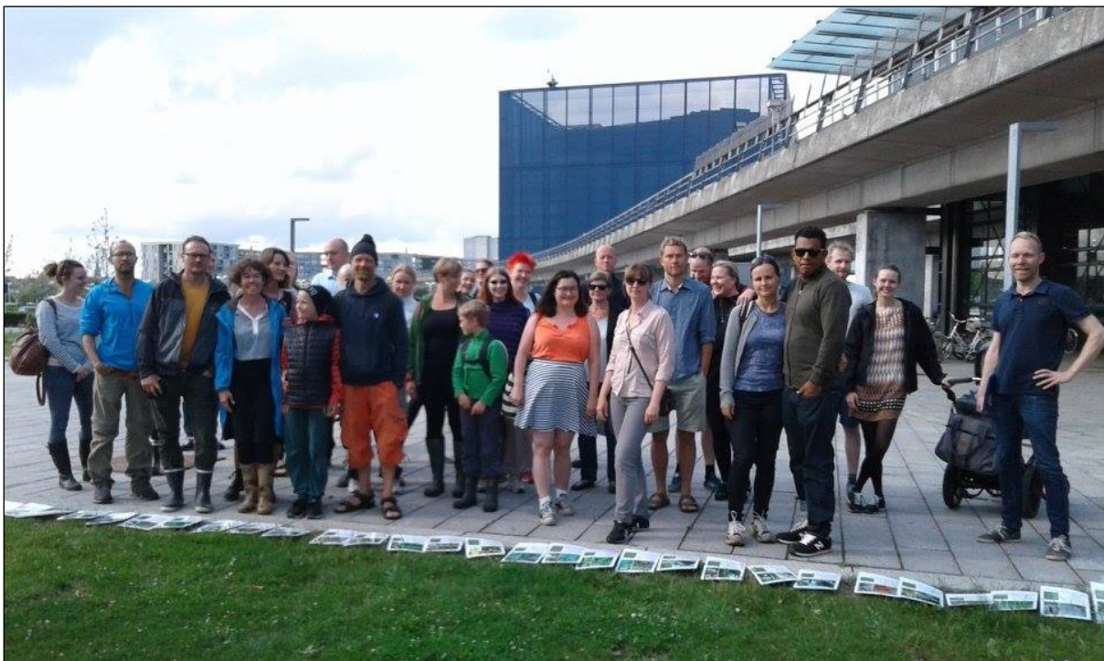
Guidet tur til Spiselige planter på Amager Fælled.

På den første offentlige tur den 29. april deltog over 80 mennesker. Turen var en succes, selvom det høje deltagerantal vanskeliggjorde formidlingen undervejs. Til den anden offentlige tur den 29. juni blev der af hensyn til formidlingen indført deltagerbegrænsning. Der deltog 30 mennesker i turen og mange ønsker om deltagelse måtte afvises.