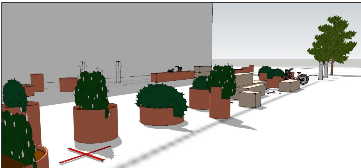
Illustration af elementer i Grønt strøg på Isafjordsgade. Lasse Schelde

Desværre lykkedes det ikke at skabe politisk opbakning til at afsætte kommunale budgetmidler til etableringen af det grønne strøg, men der har fra politisk hold, været udtryk interesse for planerne.