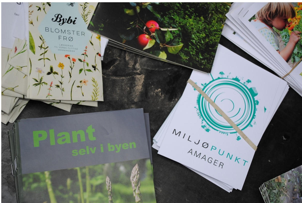
Inspirationsmaterialer til at gøre byen grønnere fra Plantekassedag i Kvarterhuset

I årsplanen for 2018 var det også et mål at tegne Amagers grønne profil endnu stærkere, bl.a. gennem at holde en nordisk konference med fokus på grøn byudvikling. Det lykkedes ikke at gennemføre konferencen i 2018. Ideen, erfaringerne og samarbejdspartnere tager vi med os i vores fremtidige planlægning. Til gengæld lykkedes det at arrangere en række erstatningsevents under titlen 'Vintergrøn' samt at afholde over 10 andre arrangementer der understreger det særlige grønne engagement på Amager.