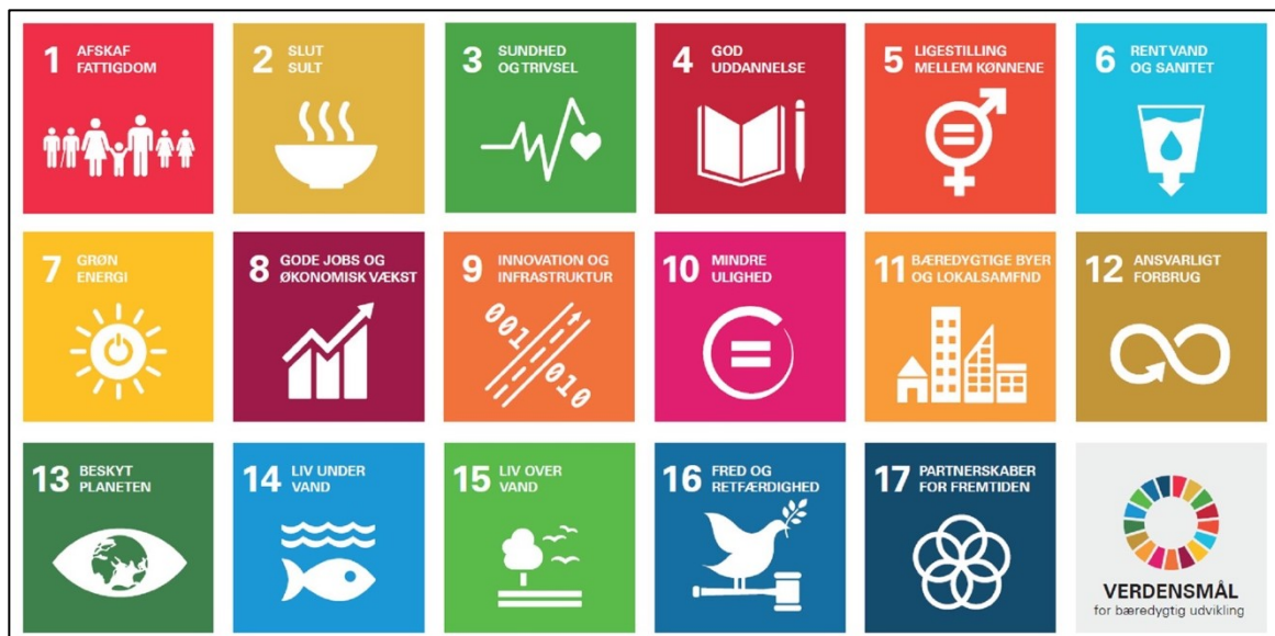
FN's 17 Verdensmål for bæredygtig udvikling

Hos Miljøpunkt Amager er alle indsatser relateret til FN's verdensmål for bæredygtig udvikling. Under hvert enkelt indsatsområde vil vi nævne det/de verdensmål som aktiviteterne/indsatsområdet understøtter. Vi ser arbejdet med at understøtte verdensmålene og udbrede kendskabet til dem som en vigtig opgave for miljøpunktet. Verdensmålene er relevante for os alle og miljøpunktet vil gerne være med til at gøre verdensmål til hverdagsmål, hvor vi alle kan gøre en indsats i vores daglige liv og arbejde.