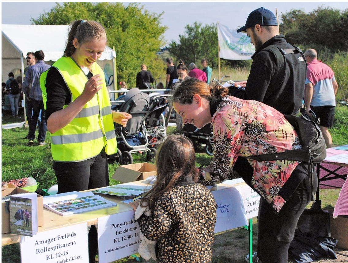
Miljøpunkt Amagers stand på Fælledens Dag

Fælledens Dag blev afholdt i samarbejde med Danmarks Naturfredningsforening, Københavns Kogræsserlaug, Amager Fælleds Rollespilsarena, Rideklubben Islands Brygge og lokale foreninger, som bruger Fælleden. Arrangementet var støttet af Amager Vest Lokaludvalg og Københavns Kommune Kultur- og Fritidsforvaltningen. På dagen blev der uddelt guiden 'Smag Amager Fælled', der blev trykt med midler fra Friluftsrådet.