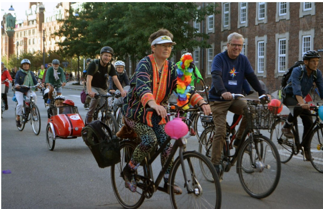
Cykelparaden under Bike Pride

Miljøpunkt Amager var medarrangør på Bike Pride som var en cykelfest og en cykelparade i forbindelse med åbning af Kulturhavn Festival 2018. Miljøpunkt Amager deltog i planlægningen og havde en bod på cykelfestpladsen hvor deltagerne kunne pimpe deres cykel med genbrugsmaterialer.